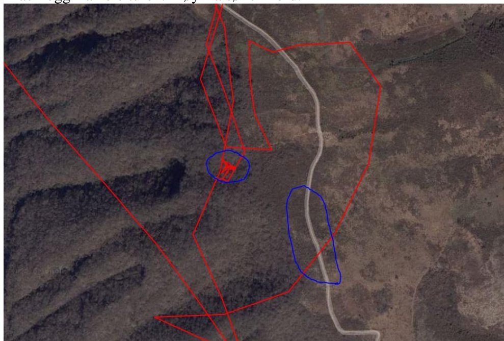
Blå ring, åstedet. Blå oval ring, bilene med vitnenes ca posisjon.