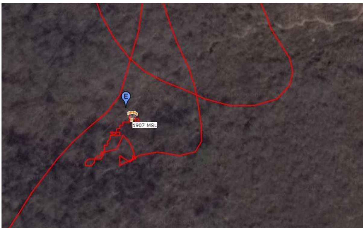
Tracklogg fra hendelsen skjedde til instrumentet «fant» sin posisjon og høyde.