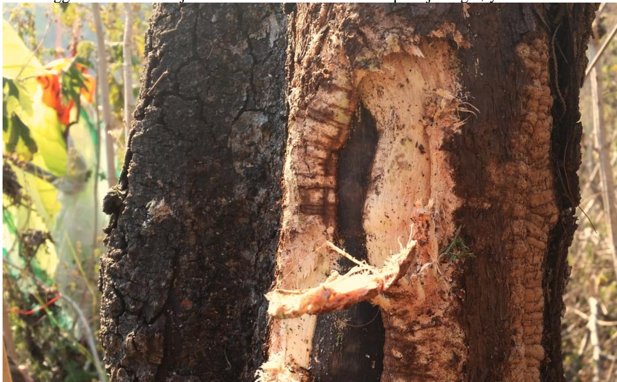
Skade på tre ved åstedet.