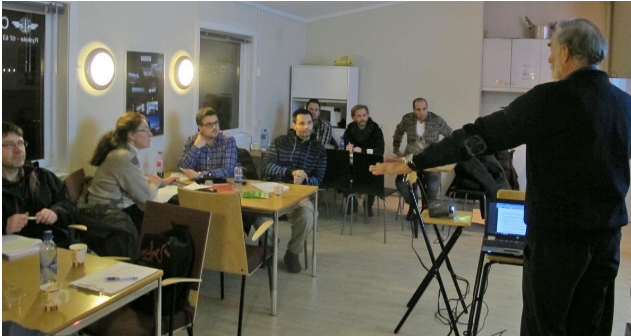
Fra en klubbkveld på Kjeller

Den som leder en «Hazid» skal be forsamlingen tenke på noe i klubbens drift og operasjoner som kan være eller bli et problem, og skrive det ned på en Post-It lapp. Løsning kommer siden.